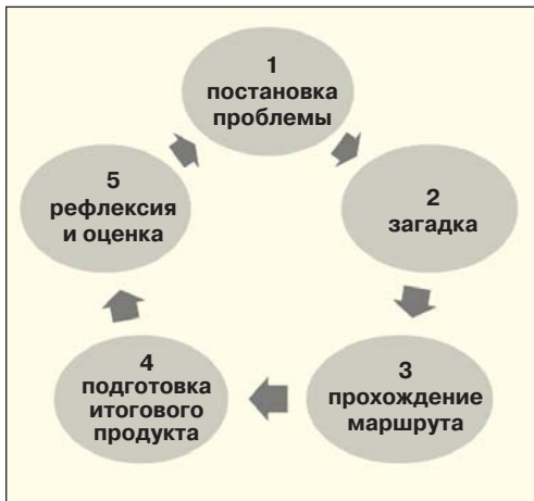
Рис. 1. Технологический цикл квест-технологии

и позволяет выявить наиболее очевидные сходства этнокультур и характерные культурные различия.